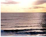
Klima und Meer

Meeresströmungen gelten neben der Atmosphäre als zweite „Klimaküche“ unseres Planeten. Wie riesige Förderbänder transportieren sie Wärmeenergie rund um den Globus und sorgen für einen Temperaturausgleich zwischen Polen und Äquator. Neben den bekannten Oberflächenströmen wie dem warmen Golfstrom rückt nun aber auch das rückströmende kalte Tiefenwasser ins Blickfeld der Forscher. Denn in der Labradorsees, einem der wenigen „Fahrstühle“ des Oberflächenwassers in die Tiefe, wurde in den vergangenen sechs Jahren eine stetige Erwärmung und somit die mögliche Abschwächung des Tiefenwasserstroms festgestellt. Neueste Daten scheinen nun jedoch erst einmal Entwarnung zu geben.