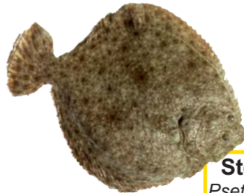
Steinbutt Psetta maxima