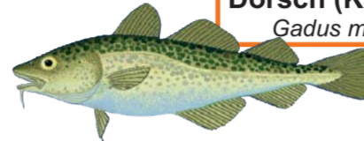
Dorsch (Kabeljau) Gadus morhua