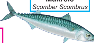
Makrele Scomber Scombrus